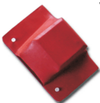
Conectores y Uniones

Para ordenar: WBC-A-X-W-L A- Tensi n: 1KV, 25KV (5-25), 35KV X- Ancho de la barra en mm W-Espesor en pulgadas (1/4, 1/2, 3/8, etc.) L- Longitud: 1000mm, 1200mm, 1500mm, 2000mm, 2400mm Ejemplo: WBC-25-100-1/2-1200